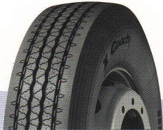
X Coach XZ

ШИНА ДЛЯ ПАССАЖИРСКИХ ПЕРЕВОЗК НА ДАЛЬНИЕ РАССТОЯНИЯ