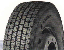
X Coach XD

ШИНА ДЛЯ ЭКСПЛУАТАЦИИ В ИЗМЕНЧИВЫХ КЛИМАТИЧЕСКИХ УСЛОВИЯХ